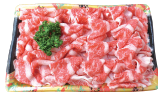
黒毛牛バラ切落し