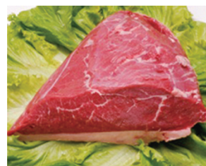
牛上モモ固り(アルカトラ)