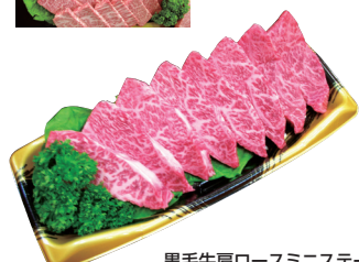
黒毛牛肩ロースミニステーキ