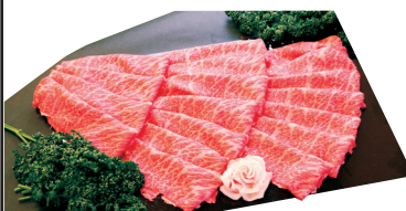
食通静岡牛 黒毛牛肩ローススライス・すき焼用・切落し