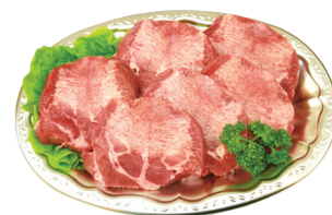
特選牛タンステーキ