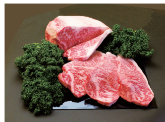
静岡そだち 黒毛和牛サーロインステーキ