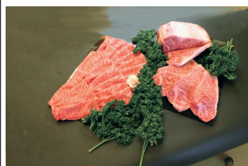
食通静岡牛 黒毛牛肩ロースステーキ・スライス (イメージ)