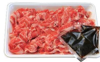
特選牛牛井用(タレ付)