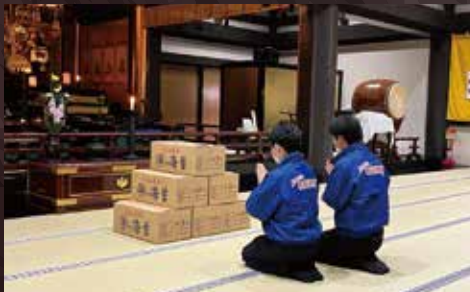
※本年度も心を込めて御祈祷させて頂きました。

七福神とは、恵比寿・大黒天・毘沙門天・弁財天・寿老人・福祿寿三尊と云う。七人の福の神様のこと。 恵比寿 商売繁盛の神様 大黒天 豊作の神様 弁財天 学問と財福の神様 毘沙門天 勝負事の神様 布袋和尚 開運・良縁・子宝の神様 福祿寿 福徳・長寿の神様 寿老人 長寿と幸福の神様