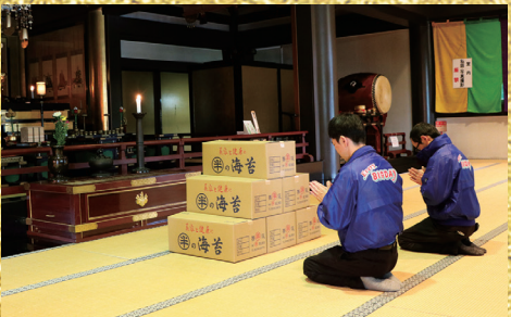
※本年度も心を込めて御祈祷させて頂きました。