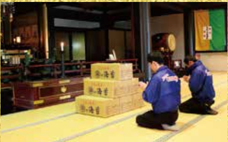
※本年度も心を込めて御祈祷させて頂きました。