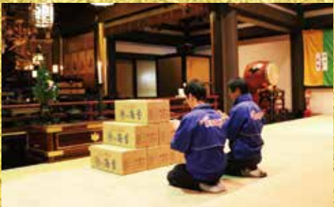
※本年度も心を込めて御祈祷させて頂きました。