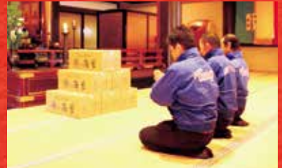
※写真は昨年度の御祈祷写真です。本年度も御祈祷させていただきます。