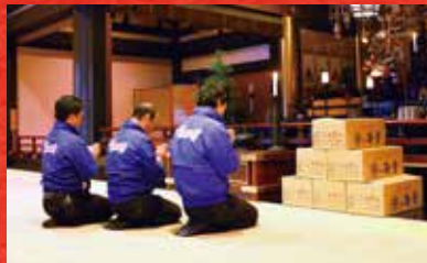
※写真は昨年度の御祈祷写真です。本年度も御祈祷させて頂きます。