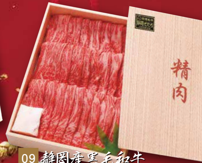
09 静岡産黒毛和牛 すき焼き・しゃぶしゃぶ用 (静岡そだち) もも肉 700g