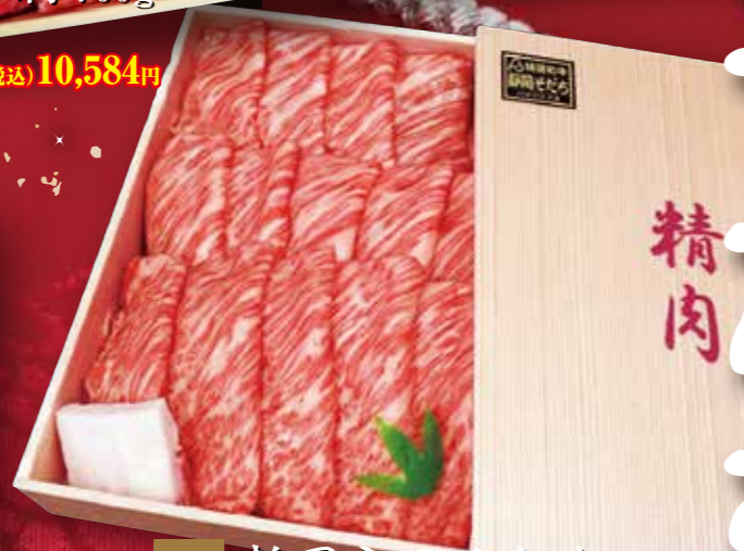
07 静岡産黒毛和牛 すき焼き・しゃぶしゃぶ用 (静岡そだち) 肩ロース肉 700g