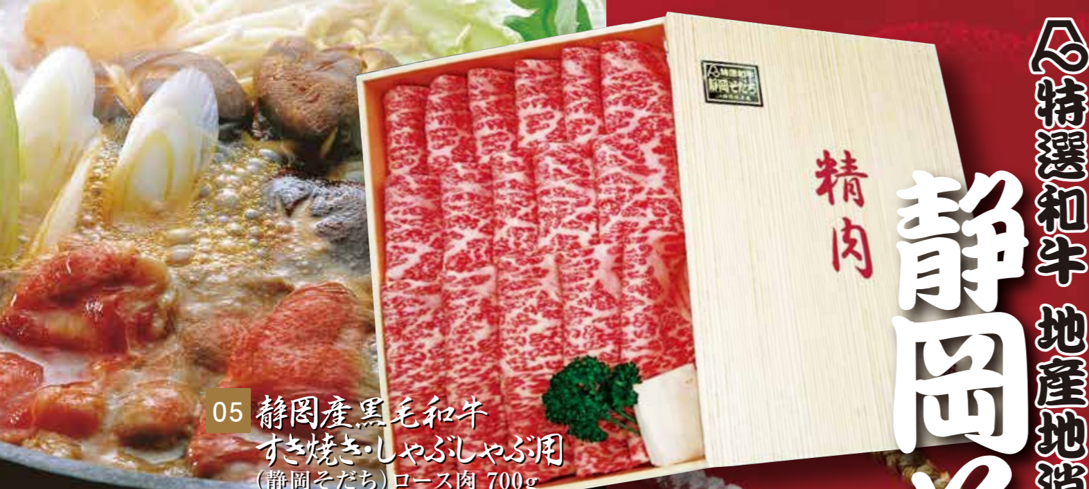
05 静岡産黒毛和牛 すき焼き・しゃぶしゃぶ用 (静岡そだち) ロース肉 700g