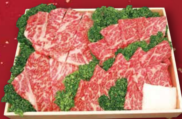
08 静岡産黒毛和牛 (静岡そだち) 厚切りカルビ (ロース&ザブトン) 500g