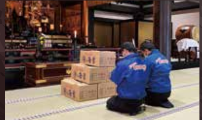
※本年度も心を込めて御祈祷させて頂きました。

七福神とは、恵比寿・大黒天・毘沙門天・弁財天・寿老人・福徳・長者の神様のこと。七人の福の神様のこと。 恵比寿 商売繁盛の神様 大黒天 豊作の神様 弁財天 学問と財福の神様 毘沙門天 勝負の神様 布袋和尚 福徳・長者の神様 福徳・長者 福徳・長者の神様 寿老人 長寿と幸福の神様