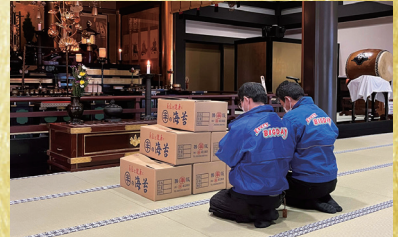
※本年度も心を込めて御祈祷させて頂きました。