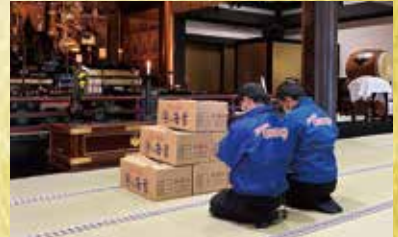
※本年度も心を込めて御祈祷させて頂きました。