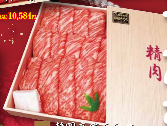
07 静岡産黒毛和牛 すき焼き・しゃぶしゃぶ用 (静岡そだち) 肩ロース肉 800g