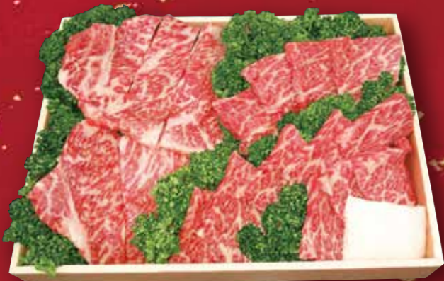
08 静岡産黒毛和牛 (静岡そだち) 厚切りカルビ (ロース&ザブトン) 500g