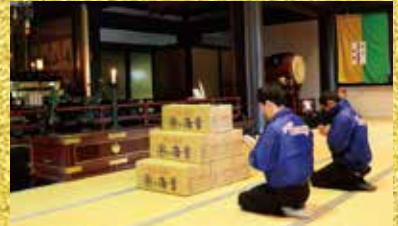
※本年度も心を込めて御祈祷させて頂きました。

七福神とは、恵比寿大黒天、辨財天、布袋尊、寿老人、福徳長者の神様、七人の福の神様のこと。 恵比寿 商売繁盛の神様 大黒天 豊作の神様 弁財天 学問と財福の神様 毘沙門天 豊財の神様 布袋和尙 願望の神様 福徳長者 福徳長者の神様 寿老人 長寿と幸福の神様