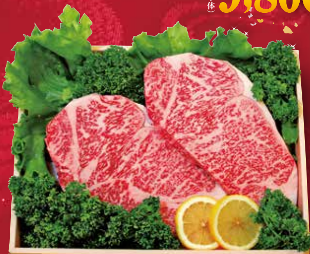
06 静岡産黒毛和牛(静岡そだち) 厚切りサーロインステーキ2枚(2枚で約500g)