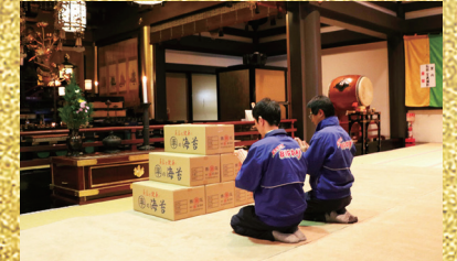
※本年度も心を込めて御祈祷させて頂きました。

七福神とは、 恵比寿大黒天、 毘沙門天、弁財天、寿老人、 福祿寿、布袋尊という、 七人の福の神様のこと。 恵比寿 商売繁盛の神様 大黒天 豊作の神様 弁財天 学問と財福の神様 毘沙門天 勝負の神様 布袋和尙 開運良縁子宝の神様 福祿寿 福徳・長寿の神様 寿老人 長寿と幸福の神様