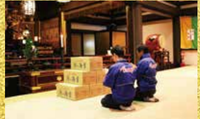
※本年度も心を込めて御祈祷させて頂きました。