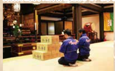
※本年度も心を込めて御祈祷させて頂きました。