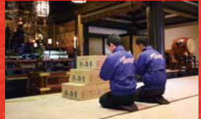
※本年度も心を込めて御祈祷させて頂きました。