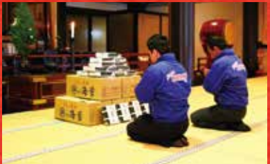
※写真は昨年度の御祈祷写真です。本年度も御祈祷させていただきます。