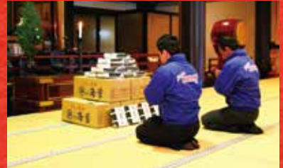
※写真は昨年度の御祈祷写真です。本年度も御祈祷させていただきます。