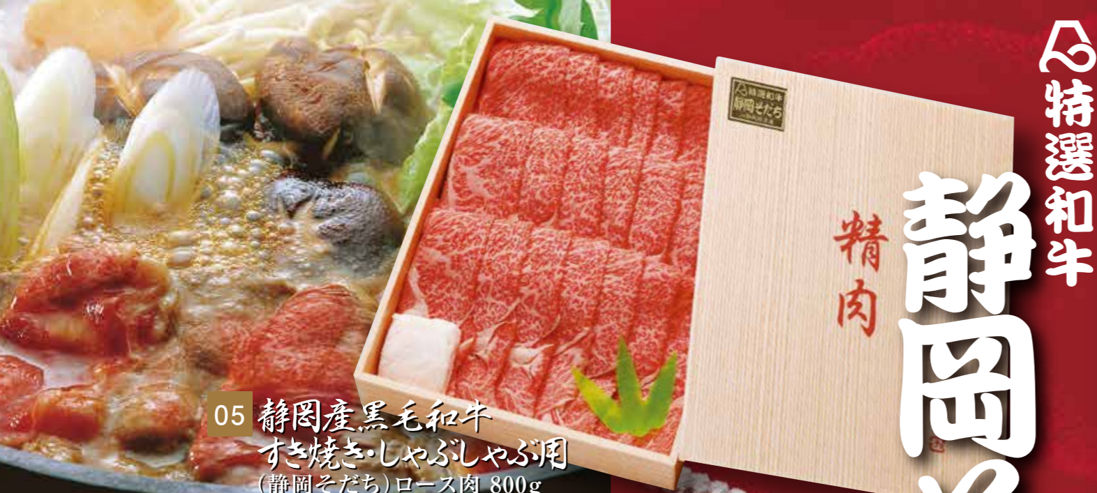
05 静岡産黒毛和牛 すき焼き・しゃぶしゃぶ用 (静岡そだち) ロース肉 800g