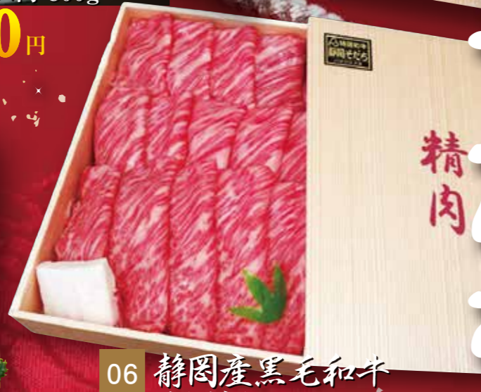
06 静岡産黒毛和牛 すき焼き・しゃぶしゃぶ用 (静岡そだち)肩ロース肉 800g