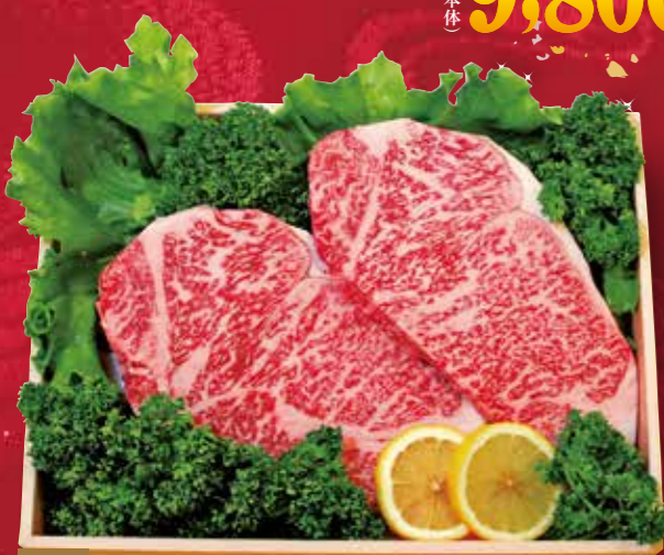
07 静岡産黒毛和牛(静岡そだち) 厚切りサーロインステーキ2枚(2枚で約500g)