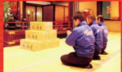
※写真は昨年度の御祈祷写真です。本年度も御祈祷させていただきます。